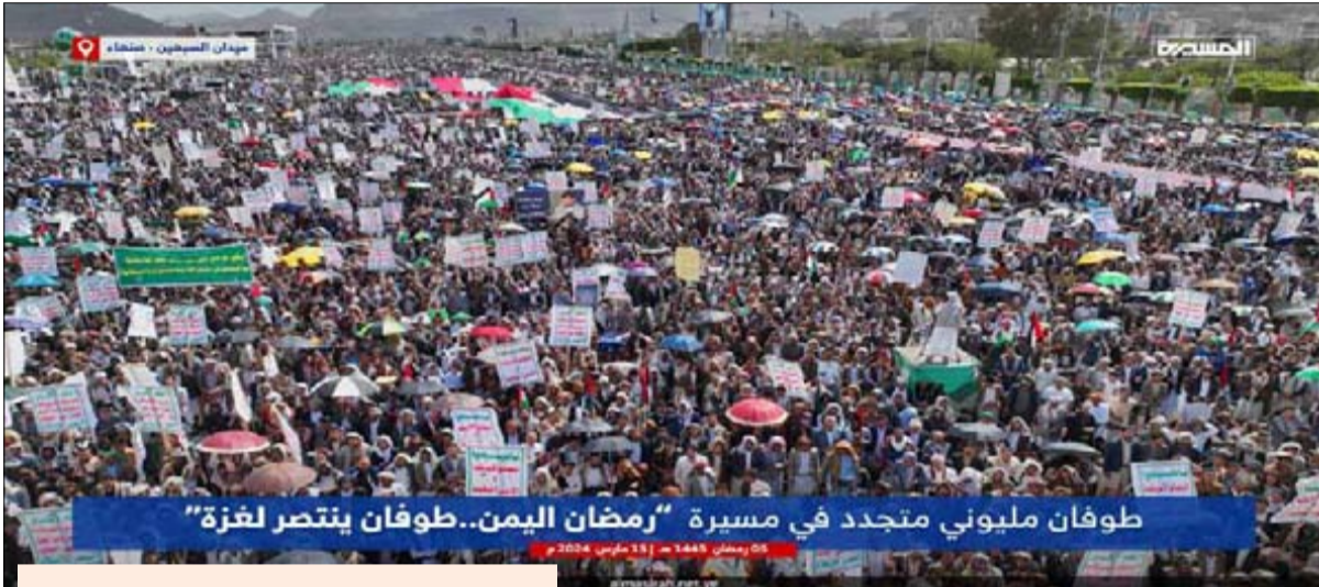
طوفان مليوني متجدد في مسيرة "رمضان اليمن.. طوفان يتصدر لغزة"

11 مسيرات جماهيرية في 16 ساحة في صعدة و19 ساحة في عمران و12 مسيرة في الجوف