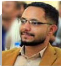
محمد بن عامر

الجمهورية اليمنية، كدولة عربية ذات تاريخ عريق، تتمتع بموقع استراتيجي هام في المنطقة، وتتميز بقيادة إيمانية قرائية، مما يمنحها القدرة على ممارسة تأثير كبير في الساحة الدولية. هذا الموقع الاستراتيجي، والقدرات العسكرية المتطورة والنشطة، جنباً إلى جنب مع القيادة الحكيمة والشجاعة، يمنح اليمن القدرة على فرض إرادتها على المجتمع الدولي والانتصار للإنسانية.. وبالفعل، تظهر القوات المسلحة اليمنية اليوم عزمها غير معهود وشجاعتها وتصبرها في مواجهة القوى العظمى، التي كانت عصية على الانسحاب منذ الدهر، وأصبحت سفنها وأساطيلها البحرية تقصف بشكل متكرر، وذلك من أجل غرة التي تعيش في وضع وصف بأنه "أكثر من كارثي".