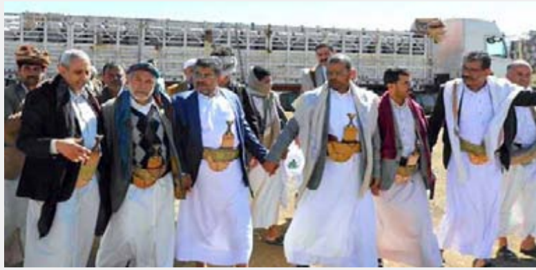
رئيس المجلس السياسي الأعلى، ورعايته لأسر الشهداء، ونوه بدور مؤسسة الشهداء والشركة اليمنية للغاز، وجهودهما في توزيع الغاز لهذه الأسر، في إطار اهتمام

معاناة تلك الأسر التي قدمت من يعولها، انتصاراً لهذا الوطن، ولظلمة الشعب اليمني. من جانبه، أشار نائب وزير النفط والمعادن الواحدي إلى أن تدشين توزيع الأسطوانات على أسر الشهداء في مختلف المحافظات يأتي تنفيذاً لتوجيهات القيادة الثورية، ورئيس المجلس السياسي الأعلى، ومتابعة حثيئة من عضو المجلس السياسي الأعلى، محمد الحوثي. وتطرق إلى آلية التنسيق بين الشركة ومؤسسة أسر الشهداء لتوزيع الأسطوانات التي تم التوجيه بها لأسر الشهداء، باعتبار ذلك أقل ما يمكن تقديمه من قبل الشركة اليمنية للغاز لساندة جهود المؤسسة في رعاية أسر الشهداء، الذين قدموا دماءهم من أجل الوطن. وأكد الواحدي استمرار وزارة النفط والمعادن، والوحدات التابعة لها، بتقديم الدعم -وفق الإمكانيات المتاحة- لهذه الفئة، ومبادأة الوفاء بالوفاة. من جانبها، عبرت أسر الشهداء والفقودين عن سعادتها وارتياحها بهذه المكرمة، التي تأتي ضمن محمل الكرمات، التي تلقاها... شاكراً القيادة الثورية والمجلس السياسي الأعلى، وكل من أسهم في رعاية أسر الشهداء والفقودين.