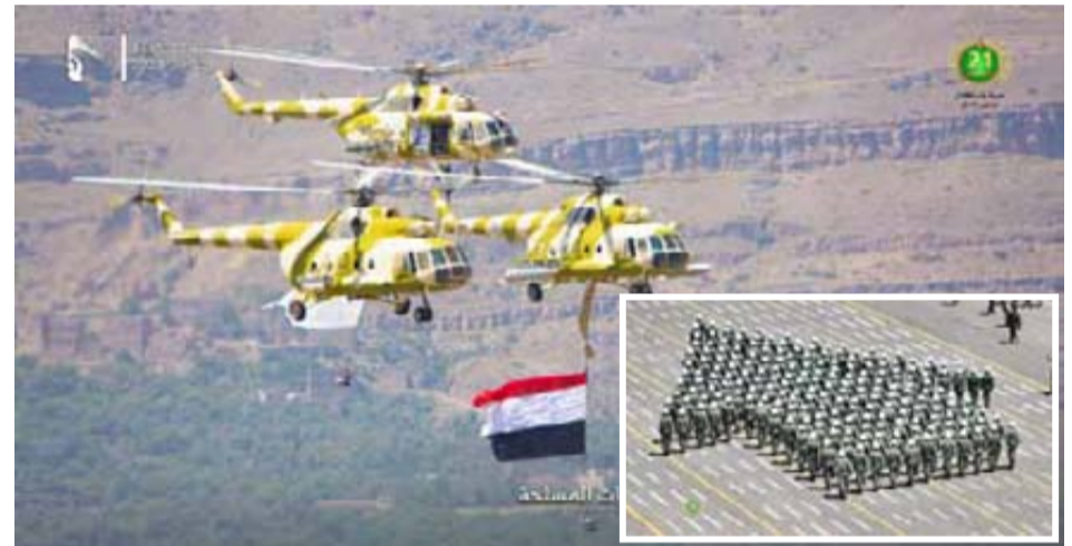
عرضت القوات المسلحة منظومات الكشف والتعقب ومنها: