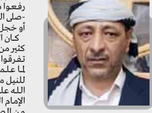
عبد الإله عبد القادر الجدي

لست أشياخي بيدرس بشدهوا جزع الخزرجي من وقع الأسل لاستهلوا وأهلوا فرحاً ثم قالوا يا يزيد لا تشل لعبت هاشم بالملك فلا جاء ولا وحى نزل وبالفعل عندما لم يستجب المؤمنون لأمر الرسول -صلى الله عليه وآله وسلم- كانت كربلاء، وكانت الفاجعة الكبرى فاجعة الفوجع والأساة التي راح قلبها وليس بعدها مأساة، والجريمة النكراء التي راح ضحيتها نخبة من الأهلئاء الصالحين الشرفاء في جريمه كان مهندسها اليهود وأخبارهم الذين ادعوا للإسلام كذبا وزورا، ومدبرها هو الدعي ابن الدعي والظليق ابن الظليق يزيد، ومعه عبيد الله بن زياد قائداً ومنقذاً، وعبيد الله بن زياد، وكلنا يعرف من يكون "زياد ابن أبيه" كما شاركه في ذلك عمر بن سعد طليبا ملك الردى الذي لم ينل منه شيئاً، إلا أنه خسر الدنيا والأخرى، وابن ذي الجوشن ذلك الذي لم يعرف الإسلام قط، وكان عبداً ماجوراً ليزيد وحزب الطلقاء، ومعهم بقية من المسلمين الدعين للإسلام وهم إلى النفاق أقرب، فرفقوا سيوفهم في وجه ابن بنت رسول الله -صلى الله عليه وآله وسلم- وبضعة للصطفى سيدة نساء الدنيا والأخرى فاطمة البتول الزهراء، لقتل الحسين بن علي، ذلك الذي قال عنه رسول الله صلى الله عليه وآله وسلم: "حسين مني وأنا من حسين".