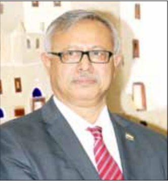
أ.د/ عبدالعزيز صالح بن حبتور رئيس مجلس الوزراء

وَدَعَتْ الجماهير اليمنية الحاشدة في العاصمة اليمنية صنعاء يوم الأربعاء بتاريخ 5 يوليو 2023م، المُفكر والسياسي والطبيب/ أحمد بن محمد عبدالله الأصححي، وُدَّعته إلى مثواه الأخير في جو حزين، وفي لحظات ألم إنساني موجه لجميع أحبابه ومعارفه وعموم المواطنين اليمنيين الذين عرفوه مسؤولاً وقائداً ومفكراً كبيراً، ملأ الدنيا في زمانه فكراً ناصحاً وسلوكاً مميّزاً، وكتابات رصينة متوازنة ثرية، كيف لا؟، وهو الطبيب الإنسان/ الأصححي قد عاش الحياة للهنية والسياسية والفكرية في بلادنا طولاً وعرضاً، اشبعها فكراً ونشاطاً تنظيمياً وإعلامياً وحزبياً وأدبياً، لأن له في كل حقل من تلك الحقول بصمة واضحة وأثرًا بَيِّنًا، ونقشًا لن يُحوى، ومساهمة كبيرة وملموسة وإيجابية.