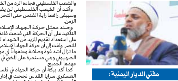
مفتي الديار اليمنية:

لن نتخلى أبداً عن اخواننا في فلسطين ولا عن مقدسات المسلمين