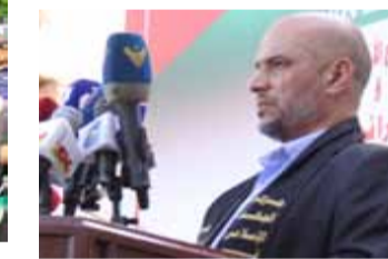
مثل حركة الجهاد الاسلامي :

رد المقاومة على اغتيال الشهداء كان موجعا