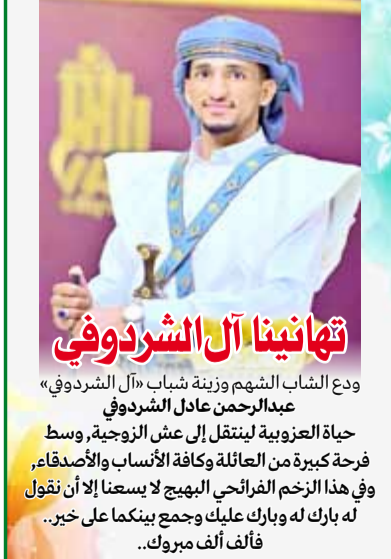
تهانينا آل الشردوفي

التي باتت تنفذ سياسة الغرب لمحو الهوية العربية والقيم التي دعنا لها الدين الإسلامي الخفيف.. * ويقول الشيخ ياسر احمد الجرف عن الذكرى الخامسة للرئيس الشهيد صالح الصماد: ** كان الشهيد الصماد رجل للرحلة رجل للمسؤولية بكل ما تعنيه الكلمة وكان قريبا من الناس وكل أوقاته تحرك وعمل وليس مثل بعض المسؤولين لا يعمل إلا في وقت الدوام ولم يستغل من أموال هذا الشعب أي مكاسب شخصية وكان في عمله وتحركاته يمثل النموذج الراقي للمسؤولية رغم اللهاط ولم يكن ساعيا من أجل التنبص وإنما تقبل هذا التنبص بعد الإلحاح عليه وكان من منطلق الإيمان وكان استهدافه من العدو السعودي بتحديد وإشراف أمريكي.. الشهيد الصماد هو من رسم الخطوط العريضة لبناء الدولة العادلة في مرحلته فارقة من مراحل التاريخ وفي ظل عدوان كوني على بلد باع الخونة بأرضه الأمان فحافظ على الجبهة الداخلية وصوب أمدار الجميع للتصدي للعدوان والغزو وقدم روحه الطاهرة دفاعا عن دينه ووطنه وأمته فسلام الله على روحه الكريم الأربعة وأحد العفارات وقد كان كخليفة.