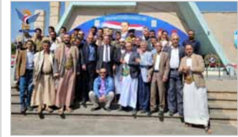
خلال الزيارة قرأ الزائر صالحو الصماد وأطلعوا على الصور الفوتوغرافية التي توثق محطات سيرته الجهادية. معرض صور الرئيس الشهيد

أكد وزير الثقافة أن الرئيس الشهيد صالح الصماد سبيل أنموذجاً وقدوة في التضحية والبذل والعطاء؛ إذ قدم حياته رخيصة في سبيل الله ولأجل دينه ووطنه. وأشار إلى أن زيارة ضريح الشهيد الرئيس صالح الصماد ومراقبته تأتي كرسالة عرفان وامتنان للشهيد الرئيس والتأكيد على لضي على دربه والسير على نهجه الجهادي. ووجه وزير الثقافة عبدالمحمد أحمد الكسبي ومعه وكلاء وزارة الثقافة ورئيس الهيئة والوزير التنفيذي لصفود الترات، أكيليلا من الزهور على ضريح الشهيد الرئيس صالح الصماد ورفاقه.