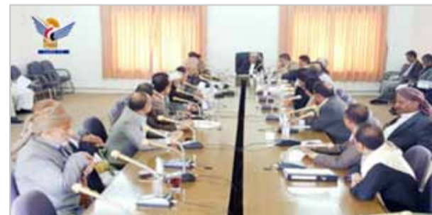
فيها صندوق صيانة الطرق. ولت إلى أن تلك الجهود تأتي في إطار تعزيز برنامج الصمود الوطني في مواجهة الآثار

وأكد نائب رئيس مجلس النواب، أهمية توحيد الجهود لتصويب الأخطاء ومعالجة الإخفاقات أينما وجدت لما من شأنه تعزيز العمل المشترك لتجاوز الصعوبات والصعوبات التي تعترض سير أداء الصناديق الخاصة، بما فيها صندوق صيانة الطرق. ولفت إلى أن تلك الجهود تأتي في إطار تعزيز برنامج الصمود الوطني في مواجهة الآثار