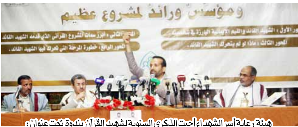
هيئة رعاية أسر الشهداء أحييت الذكرى السنوية لشهيد القرآن بندوة تحت عنوان : الشهيد القائد عنوان لقضية عادلة ومؤسس لمشروع عظيم

ازداد قوة وتحذرا.. لاأنا؟ لأنه نور الله (والله متم نوره ولو كره الكافرون) .